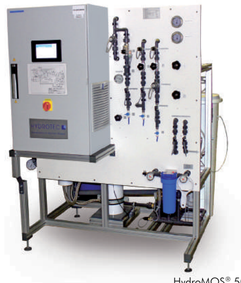
HydroMOS® 500 EDI-S

Das Beispiel zeigt, dass eine angepasste Wasseraufbereitung einen optimalen Weg zur Erzielung des qualitativ gewünschten Endproduktes darstellt und die Einhaltung der notwendigen Ressourcen-Effizienz berücksichtigt.